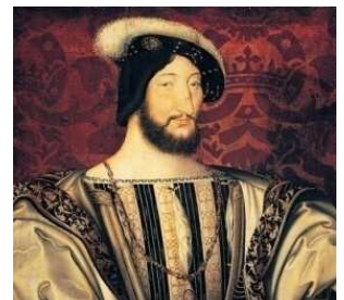
François 1 er

Pour financer le chantier du Louvre, le nouvel Hôtel de Ville, ses châteaux de la Loire et ses guerres, François 1 er a besoin d'argent. Alors il vend son domaine royal du Marais, par parcelles. Son opération immobilière a du succès : tous les nobles et les courtisans achètent des terrains dans le Marais ! Ils se font construire de somptueuses demeures, qu'on appelle des hôtels particuliers.