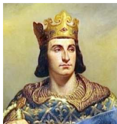
Philippe II Auguste

Paris développe son commerce, en particulier grâce au port de Grève (près de l'actuel Hôtel de Ville) et au port de l'École (près du Louvre, où débarquent les poissons de la Manche et les pommes de Normandie). On inaugure le premier marché des Halles, en 1137, pour les marchands qui commercent avec les régions du Nord (notamment les drapiers). Et vers 1200, le roi Philippe II Auguste élargit la ville grâce à la construction d'une solide muraille.